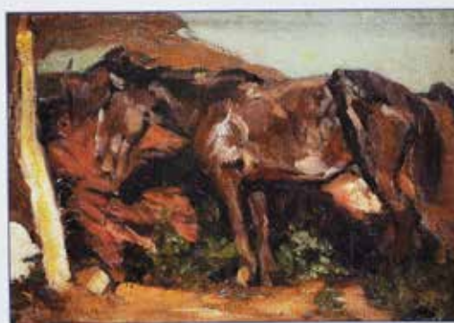
19. "CABALLAS" OIL ON CANVAS, 1974, 100 x 100 cm