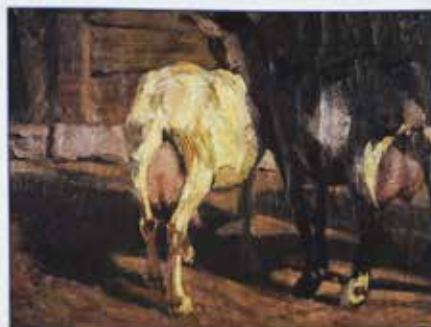
18. "LAS CABALLAS" OIL ON CANVAS, 1974, 100 x 100 cm GALERIA DE ARTE DE LA UNIVERSIDAD DE CALIFORNIA, LOS ANGELES